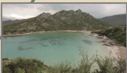
5 SAINT FLORENT