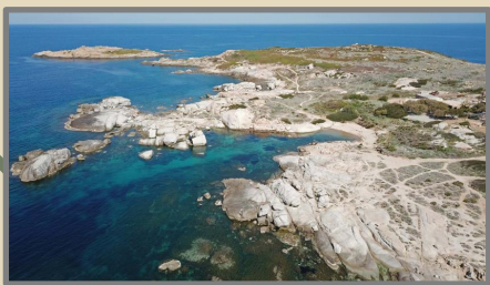
1 PUNTA SPANO