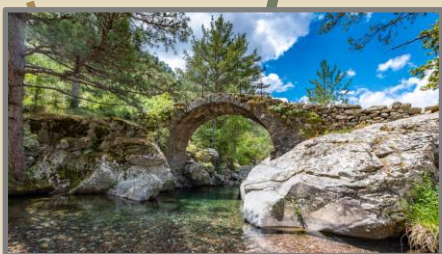
4 OLMI CAPPELLA