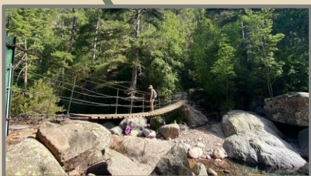
2 FORET DE BONIFATU